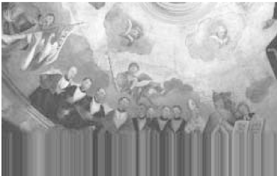
3 pav. Freskos fragmentas iš Šv. Jonų bažnyčios Paguodos koplyčios kupolo, Vilniaus universitetas dailėje , parengė D. Ramonienė, N. Tumėnienė, Vilnius, 1986.

Pasak M. Baliūnskio, skeptrą Vilniaus universitete taip pat visuomet nešė specialus skeptranešys 41 . Tačiau nei jėzuitų universitete, nei Lietuvos vyriausiojoje mokykloje jų nemini jokie šaltiniai. Pirmą kartą skeptranešiai („pedeł“) paminėti tik Imperatoriškajame Vilniaus universitete 1827 m. 42