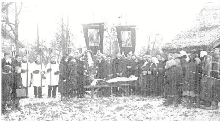
2 pav. Laidotuvės Veliuonos valsčiuje, XX a. 3-iasis dešimtmetis