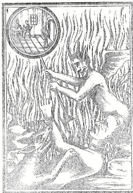
Valgydami drauge peną, rūpinkimės, idant vienas kitą neprarytumem. (Šv. Povil. pas Gal. 5.)

Gryną malonę dėl kožno išrodyk, Nesutikimus greitai pasigadyk. Jei rūstinantį pirmas perprašysi, Meilina Dievą dėl savęs matysi.