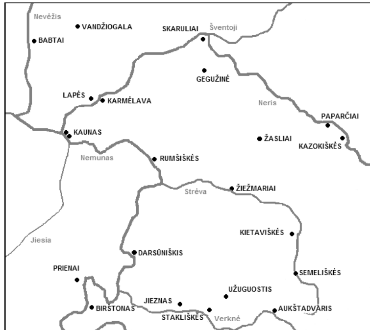
3 pav. Kauno dekanatas XVII a. pabaigoje