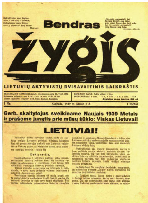
2 pav. Žurnalo Bendras žygis 1939 m. Nr. 1 pirmasis puslapis

Sugrįžkime prie šios deklaracijos nuostatų ir palyginkime jas su prieš porą savaitių Žygyje paskelbta programa. Matome akivaizdžius skirtumus. Štai deklaracijos 1-ame punkte, nors pradžioje reikalaujama „grąžinti tautai laisvę rinkti į savivaldybes ir Seimą tokius atstovus, kurių nori žmonių dauguma“, tuoj pat pabrėžiama, kad „negali būti grįžimo į seną frakcinę parlamentarizmą sistemą, o valdymo forma turi būti pagrįsta tautos vieningumu ir drausme“; deklaracijos 3-iam punkte pabrėžiamas pernelyg didelis lietuvių nacionalizmas tautinių mažumų atžvilgiu: „užkariauti lietuviams tinkamas pozicijas pramonėje ir prekyboje, įvedant planingą aktyvizmą tautos ūkyje“; deklaracijos 12-ame punkte išskirtinis dėmesys skiriamas Lietuvos santykiams su Vokietija. Likusieji deklaracijos punktai galbūt kiek detalesni už anksčiau išdėstytus „Ašies“ programoje, pvz., kalbama apie žemės ūkio darbininkų gyvenimo sąlygų pagerinimą, reikiamą valdininkų kompetenciją, tolerancijos išlaikymą religijoje.