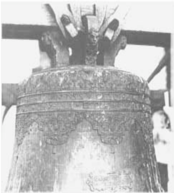
3. Krekenavos bažnyčios varpo fragmentas

NATVS/ TVLIT ESSE TVVS“. Būdingas Breutelto signatūros stačiakampis nulietas priešingame bareljefui liemens šone; jame stinga dviejų paskutiniųjų datos skaitmenų 30 .