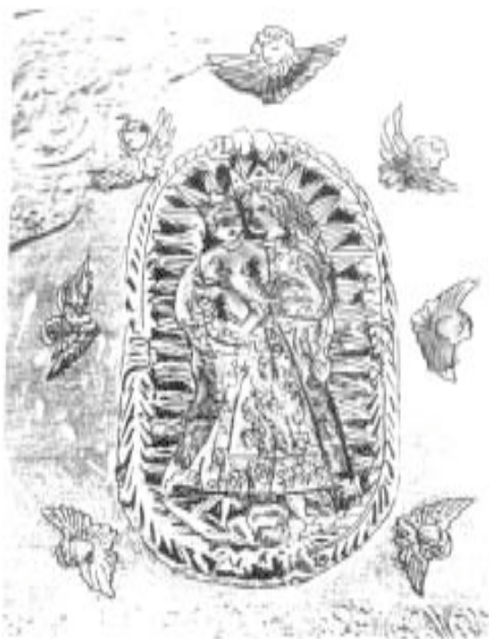
4. Krekenavos bažnyčios varpo fragmentas. Bareljefas „Švč. Mergelė Marija su Vaikeliu“