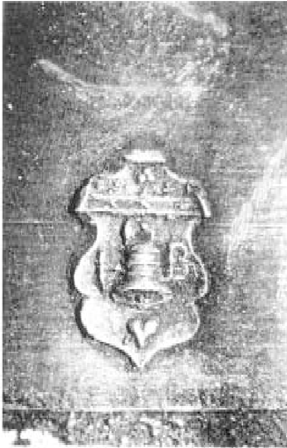
2. Tilžės bažnyčios varpo signatūra su inicialais „IB“