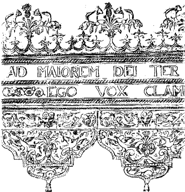
7. Plungės bažnyčios varpo frizo fragmentas