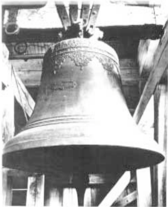
6. Viduklės bažnyčios varpas

rašai nenurodyti, dabartinės šio kūrinio buvimo vietos nepavyko nustatyti. Tarp kultūros paminklų neįregistruotas.