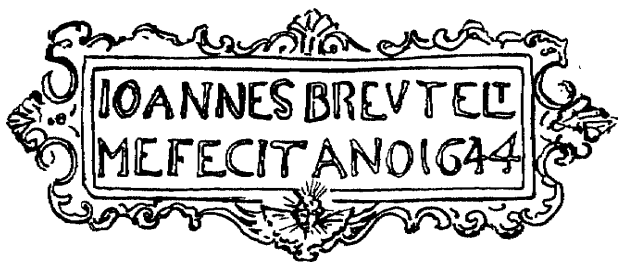
5. Viduklės bažnyčios varpo signatūra