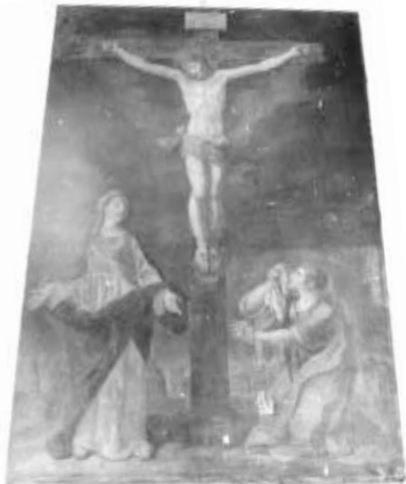
5. „Nukryžiuotasis Jėzus“. Vilniaus meno m-los dailininkas. Šalčininkėlių bažnyčia.

Nemajūnų vėliavos paveikslo „Nukryžiuotasis“ padeda numatyti dar vieną menotyrinį uždavinį. Šalči-