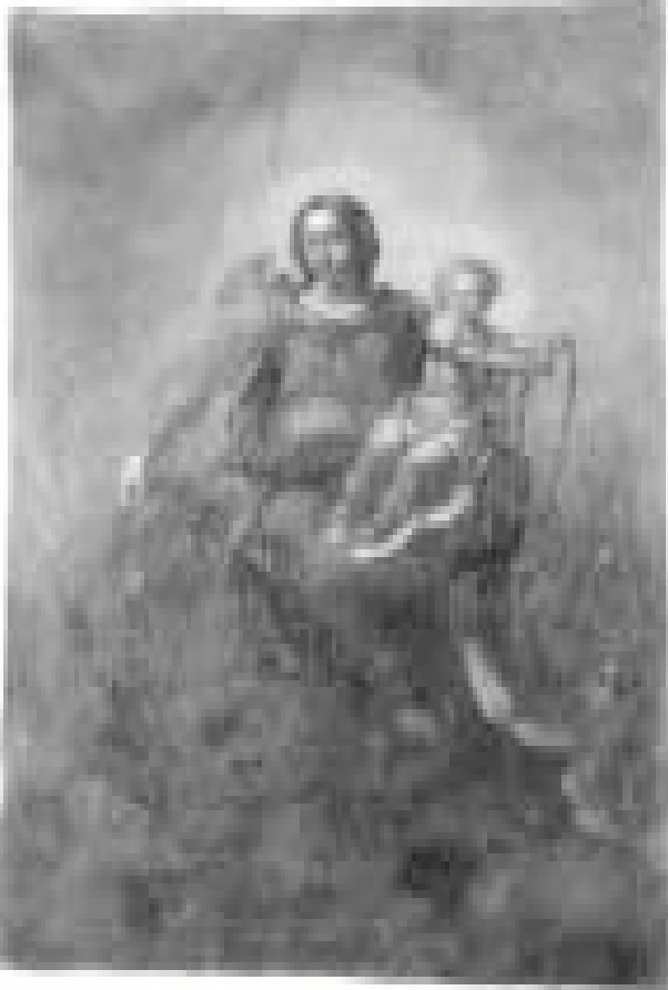
1. „Švč. Mergelė Marija, Sielų Gelbėtoja“. Dail. P. Smuglevičius. Nemajūnų bažnyčia .