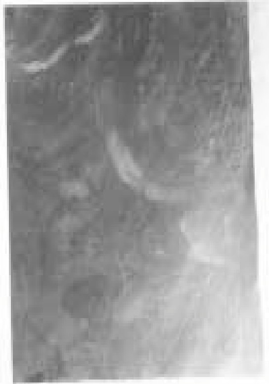
3. Paveikslo „Švč. Mergelė Marija, Sielų Gelbėtoja“ fragmentas. Aloyzo Petrašiūno fotografija, 2000 m.

iki tol, bet buvo prisiūtas prie audinio, parodant tik Nukryžiuotąjį, o antroje vėliavos pusėje įkomponuojant jau kitą – giltinės atvaizdą. Dar kartą pertvarkant vėliavą 1881 m. paveikslas vėl galėjo būti įtvirtintas taip, kaip iš pat pradžių. Juo labiau kad tuomet jis ir turėjo būti atnaujintas užtapant ant viršaus. Abiem aptartais atvejais manytina, kad vėliava (pir-