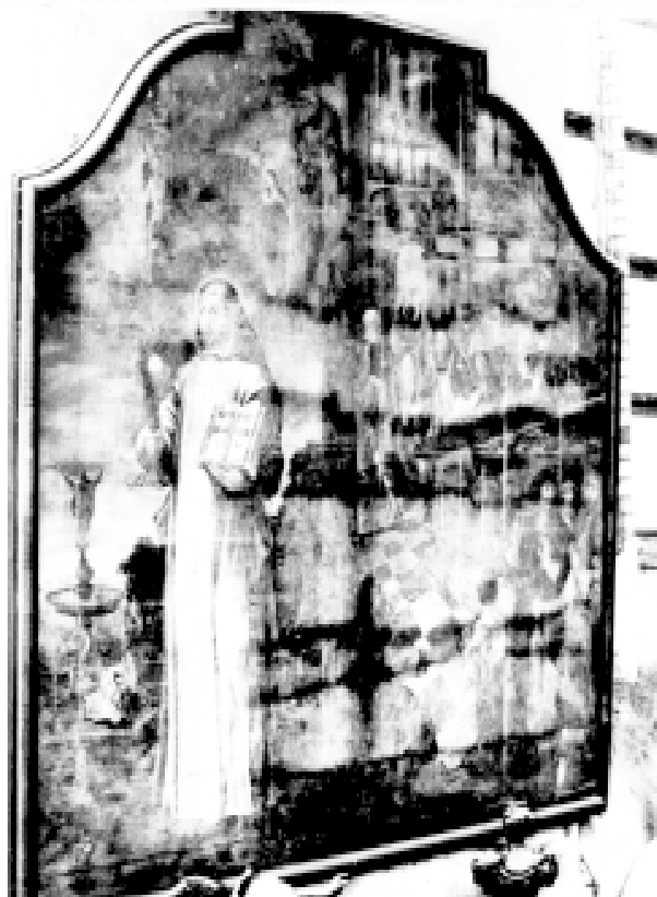
1. „Šv. Brunonas“. XX a. pradžia.