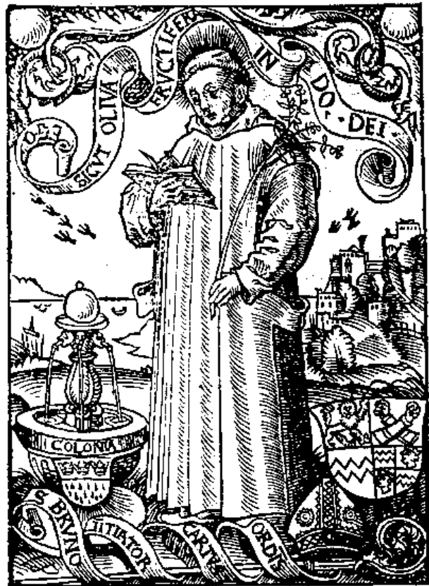
4. „Šv. Brunonas“. 1516–1520. Antono Woensamo medžio raižinys. Iš knygos: Analecta Cartusiana. The mystical tradition and the Carthusians , vol. 13, Salzburg, 1997, il. 21.

Visa paveikslo „idėjinė programa“ turi aiškiai anti-protestantišką nuostatą: šventųjų ir Švč. Mergelės Marijos kultas, Švč. Sakramento pripažinimas ir garbinimas, netgi pati vienuoliško gyvenimo institucija susiejama su dieviškuoju gyvenimo šaltiniu ir priešpriešinama pasaulio išminčiai bei netikrai šlovei, vedančiai į amžinąjį pasmerkimą (beje, miręs teologas čia pavaizduotas kaip protestantų dvasininkas).