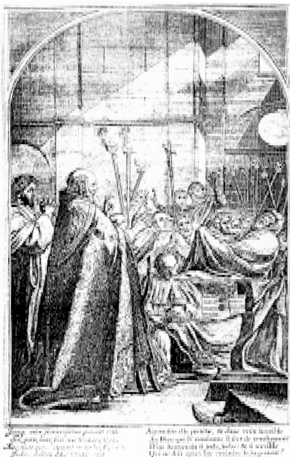
3. „Paryžiaus teologo laidotuvsė“. F. Chauveau raižinys pagal E. Le Sueur paveikslą. Iš knygos: Analecta Cartusiana. The mystical tradition and the Carthusians , vol. 13, Salzburg, 1997, il. 14 a.

Kairėje paveiklo pusėje, peizažo fone, nutapytas visos figūros šventojo „portretas“: baltu kartūzų abitu vilkintis šventasis vienoje rankoje laiko monstranciją, kitoje – atverstą knygą. Virš šventojo figūros danguje nutapytas Nukryžiuotasis (kairėje) ir Nekaltai Pradėtoji Švč. Mergelė Marija (stovinti ant pusmėnulio), tarp jų, aukščiau danguje, – žvaigždė. Apatiniame kairiajame paveiklo kampe, peizaže, nuta-