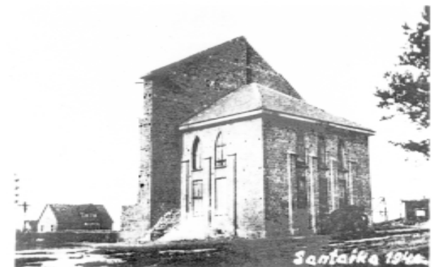
3. Statomos Sentaikos bažnyčios zakristija ir koplyčia, 1940 m. LNMA , F. N. M., apr. Nr. 237, l. 51 (V. Balčyčio kopija, 1999 m.)