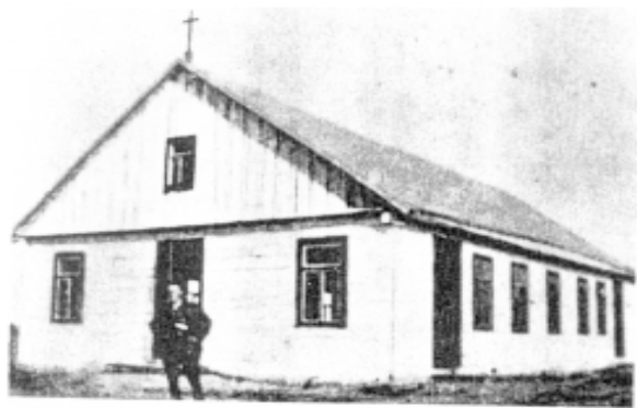
1. Laikinoji Santaikos bažnyčia, 1930 m.