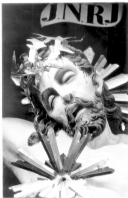
4. Skulptūros „Nukryžiuotasis“ fragmentas (XVII a.). Žemaičių Kalvarijos bažnyčia (V. Balčyčio nuotrauka, 2001)

J. Tiškevičiaus valią galėjo lemti Lenkijos provincijos dominikonų aktyvumas ir spartus konventų skaičiaus augimas XVII a. pradžioje. Teologinėmis studijomis, kontempliacija ir evangeliniu apaštalavimu pagrįsta dominikonų sielovados veikla atitiko į