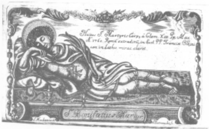
3. Šv. Bonifacas kankinys. Iliustracija iš knygos „O Sprawozdzeniu y złozeniu ciała Swietego Bonifacego Męczennika w kościele Olkinickim krótka Wiadomość ...“, Vilniaus universiteto biblioteka