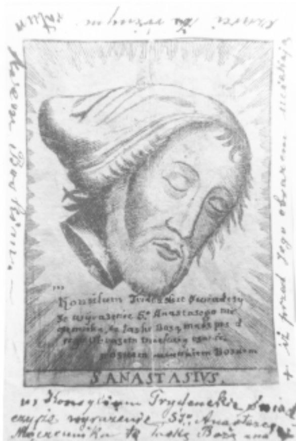
5. Šv. Anastazijaus relikvijos atvaizdas, Krokvos Vesioloje basųjų karmeličių biblioteka

garbei pastatydintoje bazilikoje liepė įrašyti dedikaciją: „Condidit Ambrosius templum Domino[que] sacrauit, nomine Apostolico munere reliquis [...]“. Reliquiae reiškia ne tik šventojo kūną, jo dalį, bet ir rūbus bei kitus daiktus, kurie lietsi prie jo ir įgijo šventumo.