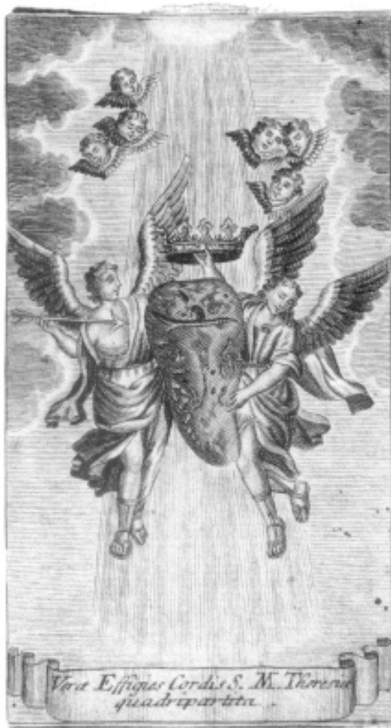
4. Šv. Teresės Avilietės širdies relikvijos atvaizdas, Krokuvos Vesioloje basųjų karmeličių biblioteka

Šv. Bonifacas paskelbtas naujuoju Valkininkų ir visos Lietuvos globėju. Ar prigijo svečio iš Romos kultas, ar buvo užfiksuota prie šventojo kapo patirtų stebuklų? Ar lankydavo Valkininkų bažnyčią piligrimai dėl šv. Bonifaco kūno, ar traukė čion seniau pradėto garbinti Loreto Marijos paveikslo „kviečiami“? Tai klausimai, kurie šiame straipsnyje liks neatsakyti. Tačiau mūsų nagrinėjamas šaltinis raiškiai byloja apie šv. Bonifaco relikvijų atvežimo paskirtį „didesnei Dievo garbei, dvasinės tikinčiųjų žmonių gerovės padauginimui, šio krašto nuo Dievo bausmės apgynimui [...], taip pat skurdžios vietos papuošimui“ 56 .