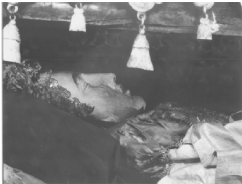
1–2. Šv. Bonifaco kankinio relikvijos Valkininkų bažnyčioje.