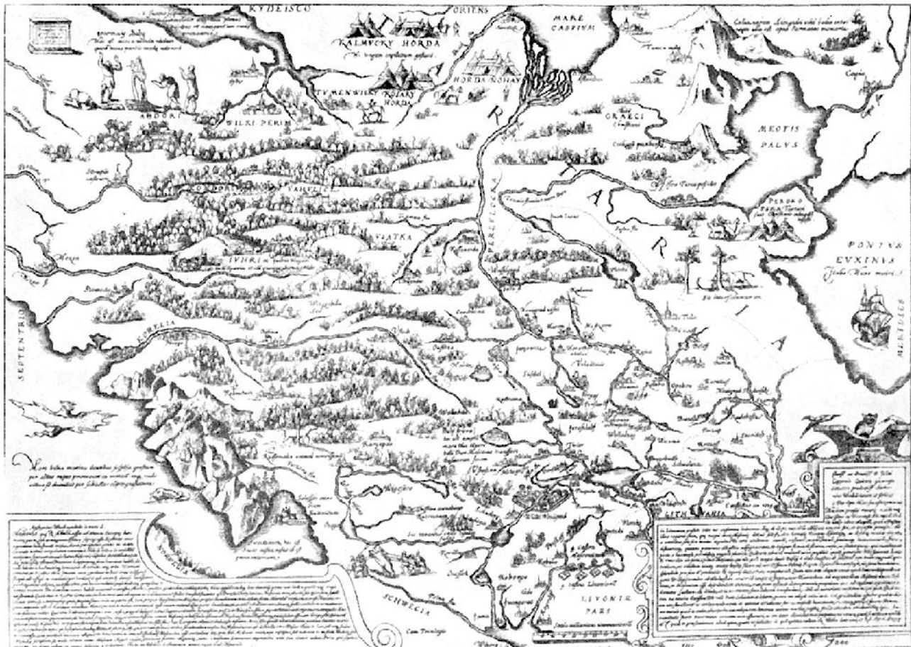
2 pav. A. Wiedas, Maskvos valstybės žemėlapis (1570 m.), Б. А. Рыбаков, Русские карты Москвы , Москва, 1974 [iklijia]