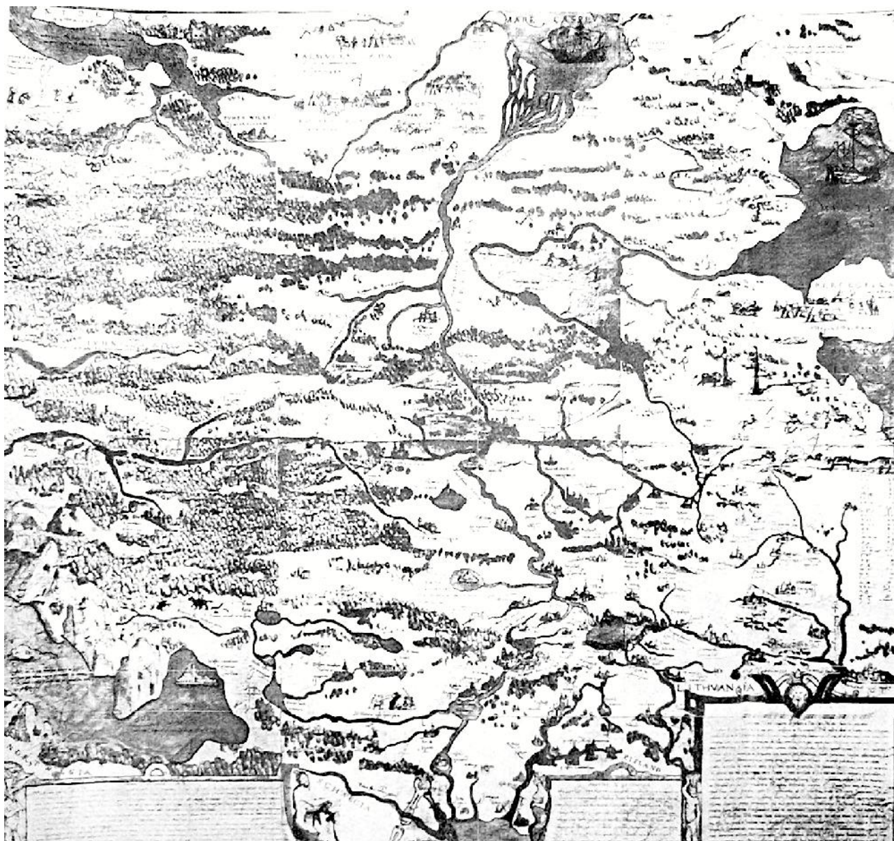
1 pav. A. Wiedas, Maskvos valstybės žemėlapis (1555 m.), A. Samas, Žemėlapiai ir jų kūrėjai , Vilnius, 1997, p. 112–113

Kartografiškai abu variantai yra panašūs: jie pasižymi panašia struktūra ir objektais. Vienas esminių požymių – žemėlapiams būdinga atvirkštinė šalių orientacija 13 . Net ir ikonografiniu aspektu dauguma motyvų kartojasi. Pavyzdžiui, maždaug tuose pačiuose taškuose pateikti beveik analogiški stumbro medžioklės, Oršos mūšio, Aukso senės ir kiti vaizdai. Skiriasi vario graviūros technika atliktų žemėlapių formatas, dydis, stilistika ir kai kurie motyvai. 1555 m. formatas (86 × 83 cm) artimas kvadratui, 1570-ųjų – stačiakampis (47,5 × 34,2 cm).