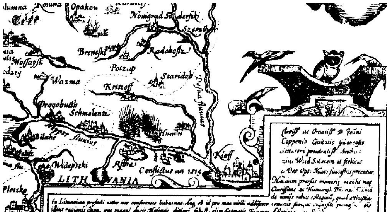
4 pav. 1570 m. žemėlapių fragmentas. Paukščiai

despotiški valdovai valdo daugybę keisčiausiai, varkaričiams sunkiai suvokiamais papročiais bei gyvenimo būdu pasižymintį tautų 30 .