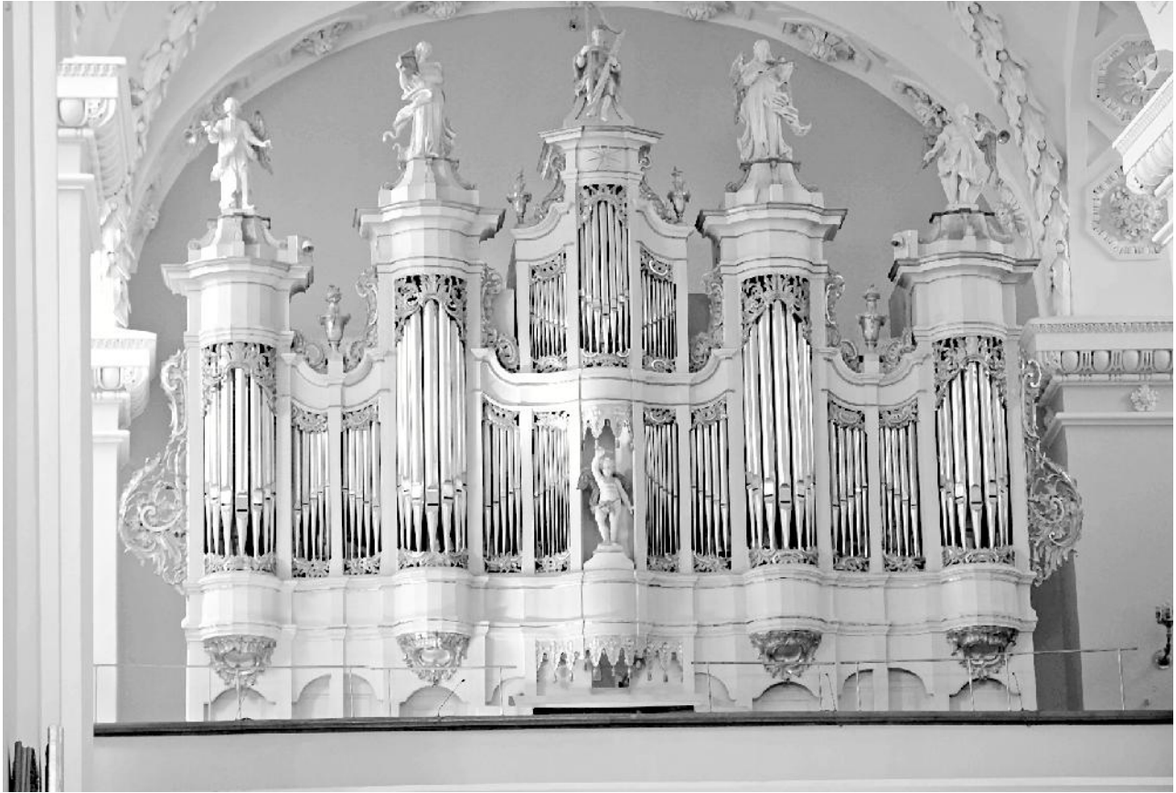
1 pav. Vilniaus Arkikatedros vargonų dabartinis vaizdas