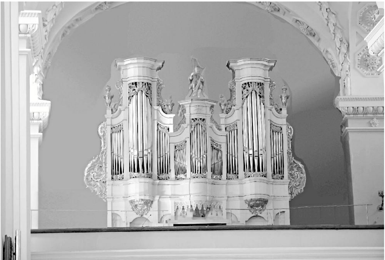
2 pav. Vilniaus Arkikatedros vargonų rekonstruotas autentiškas vaizdas, G. Povilionio nuotrauka, montažas – Rimos Povilionienės