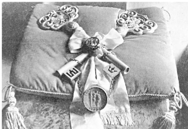
4 pav. F. Ruščicas. Iš sidabro padirbinti Vilniaus raktai.

čicas įžengimą į Vilnių matė kiek kitaip. „Tygodnik Ilustrowany“ pasirodžiusiame jo straipsnyje labiau juntamas fatališkai romantiškas istorijos posūkiu neišvengiamumas ir išsivadavimo nuo bolševikų euforija 25 . Tuomet akcentuoti pačio menininko išgyvenimai, gamtos simboliniai ženklai, gyventojų nuotikos, tačiau J. Pilsudskio vaidmuo nesureikšminamas. Apie tai byloja ir du F. Ruščico piešiniai. Viename, vaizduojančiame įžengimą į Vilnių, galima tik numanyti, kad kiek pakumpusi figūra (neryškiai išskirta ryškesniu kontūru) gali būti J. Pilsudskio, tuo tarpu į akis krenta monumentalni Aušros vartų architektūra, laisvais štrichais pažymėta žmonių masė, plevėsuojančios ulonų vėliavėlės (2 pav.). Minioje ištirpusi J. Pilsudskio figūra pavaizduota ir kitame piešinyje: tik geriau išsižūrėję matome išpieštą žmo-