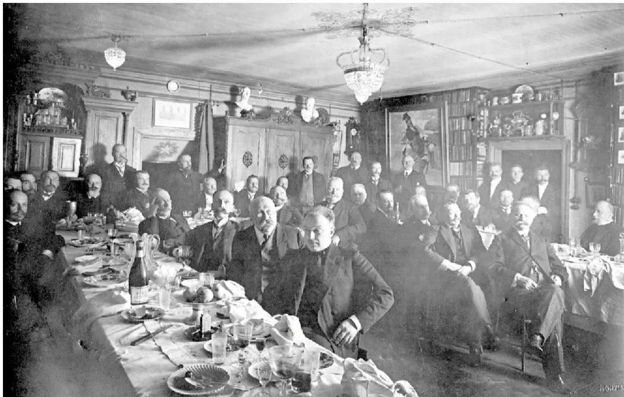
1 pav. „Neošubravcų“ draugijos kūčių vakarienė Vilniuje. 19,6 × 28,7, 1912.