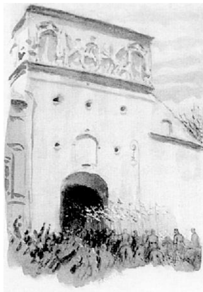
2 pav. F. Ruščicas. Juzefo Pilsudskio įžengimas į Vilnių. Reprodukuota iš: Wilno i Ziemia Wileńska , 1930–1931, t. 1, il. 25