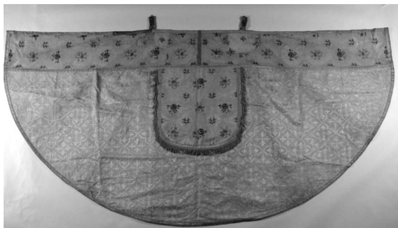
6 pav. XIX a. IV ketvirčio baltos liturginės spalvos kapa, pasiūta Varšuvoje veikusioje dirbtuvėje „T. Sirakacz i syn“ (S. Poligienės nuotr., 2007)

dekoruoto plokščiai stilizuotais augaliniais motyvais. Sidabriniame audinio fone išaustas stambaus raporto subornamentas. Atskiros jo dalys paryškintos aukso spalvos siūlais, o ornamentą sudarančios prarečiumi išdėstytos gėlių puokštės brošuotos nesuktais šilkiniais siūlais. Drabužio pakraščius, kolonas, apykaklės kraštus ir statmenį akcentuoja dviejų pločių geometrinio rašto aukso spalvos galionai. Arnotas ir identiško audinio bursa sudaro komplektą.