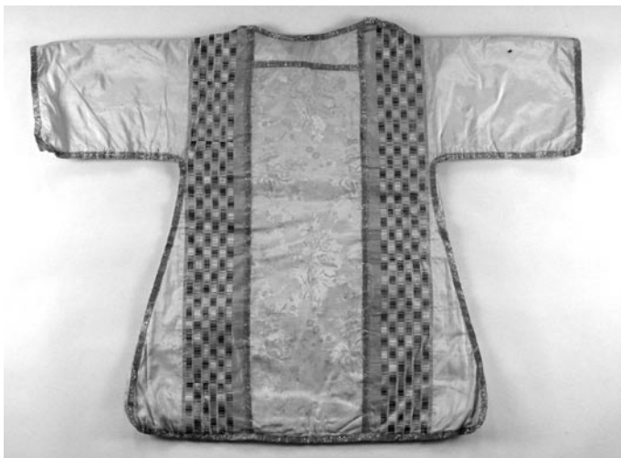
4 pav. Dalmatika, 1860 (2007)

šonai apsiūti beveik šimtmečių vėlesniu piniku, imituojančiu baroko laikotarpio apvadus. Individuali arnoto ypatybė – trumpesnės nei įprasta priekio ir nugaros kolonos. Arnotas minimas Kriaunų bažnyčios 1823 m. inventoriuje 24 ir 1830 m. vizitacijos akte 25 , kur aprašomas kaip raudono atlaso drabužis, su kolonomis, atastomis „didelėmis gėlėmis“, apsiūtas sidabriniais piniku, su baltos drobės pamušalu, turėjęs visus rekvizitus, kurie, deja, neišliko. Kitas įdomus raudonos liturginės spalvos tradicinio kirpimo arnotas (DV 2408) pasiūtas iš trijų skirtingų audinių: šonai sukirpti iš XVIII a. III ketvirčio šilkinio ripso, nugaros kolonai panaudotas dramblio kaulo spalvos šilkinis brokatas (XVIII a. vid., Prancūzija), o nusidėvėjęs priekio kolonos audinys pakeistas rausvu klasicizmo stiliškos atlasinio pynimo šilkiniais audiniais, išaustu vienoje iš XVIII a. II pusėje Lietuvos Didžiojoje Kunigaikštystėje veikusiu šilko audyklių.