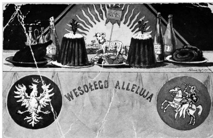
5 pav. Velykų atvirukas, 3–4 dešimtmetis.