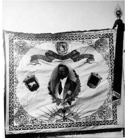
2 pav. Karo mokyklos vėliava, padovanota mokyklai 1929 m. prezidento Antano Smetonos jo vardo suteikimo mokyklai proga.

„Puoškime mūsų kareivines“, – kvietė kariuomenei skirtas žurnalas Kardas ir kaip sektingą pavyzdį pateikė Antrojo artilerijos pulko 6-os baterijos kareivinių patalpas Šančiuose, kurios pačių karių buvo išstapytos Gedimino sapno siužetiniais vaizdais, Vilniaus katedros, Aušros vartų ir kitais sostinės paminklų motyvais, Otto Jenerio paveikslų kopijomis 16 .