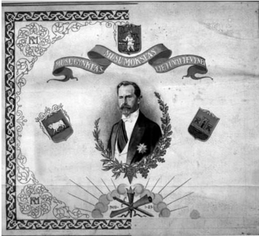
1 pav. Nežinomas autorius. Karo mokyklos vėliavos projektas, 3 dešimtmetis. Popierius, akvarelė, 35,5 × 41,5. ( Trakų istorijos muziejus TIM GEK 29507 D 938 ).