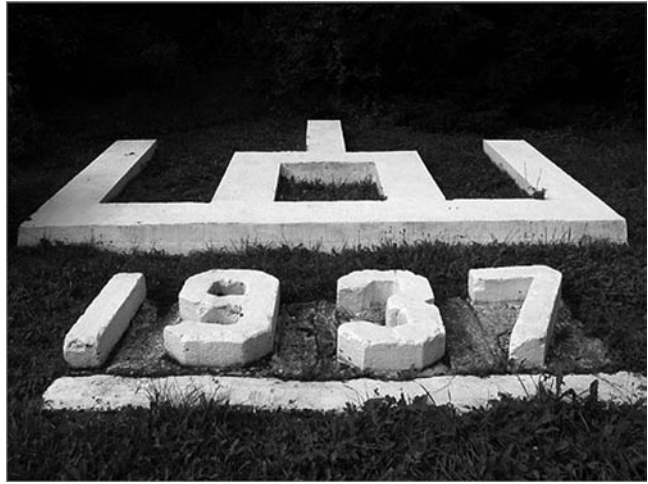
9 pav. Gedimino stulpai prie Ariogalos, sumūryti tiesiant Žemaičių plentą, 1937