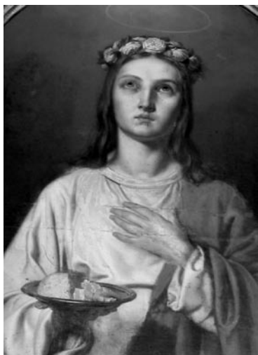
15 pav. A. Mužinovskis. „Šv. Agota“ (fragmentas), 1875 (Griškabūdžio bažnyčia). 2004

I. 30. Šv. Jurgis. 1873–1874* m. Drobė, aliejus, 90 × 70.