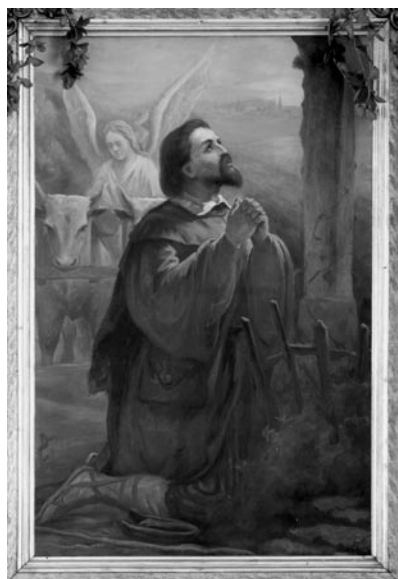
22 pav. V. Lukoševičius. „Šv. Izidorius“, 1892 (Ilguvos bažnyčia). V. Balčyčio nuotr., 2004

Tikriausiai 1892 m. eksponuotas Varšuvos Dailės salone ( Salon Artystyczny ).