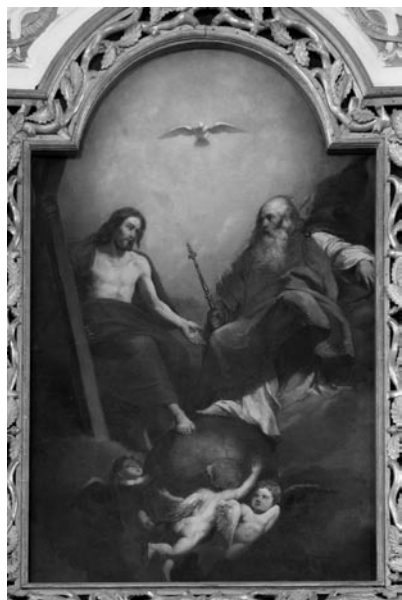
21 pav. K. Alchimavičius. „Šv. Trejybė“, 1873–1874 (Griškabūdžio bažnyčia). V. Balčyčio nuotr., 2004