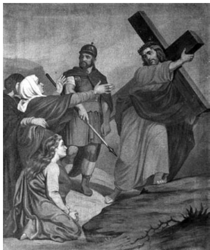
8 pav. K. Gurnickis. VII Kryžiaus kelio stotis, 1882–1883 (Balbieriškio bažnyčia). V. Balčyčio nuotr., 2002