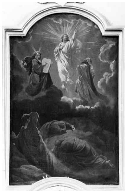
7 pav. J. N. Grotas. „Jėzaus Atsimainymas“, 1895 (?) (Krokialaukio bažnyčia). V. Balčyčio nuotr., 2002

Balbieriškio bažnyčios 1898 m. vizitacijos aktas. Ar Ęm . I. T. 16 (lapai nenumeruoti); Balbieriškio bažnyčios Rožinio brolijos 1870–1895 m. knyga. Balbieriškio bažnyčios archyvas (BBA) (lapai nenumeruoti); Paminklų sąrašas : 719 (DV 2183); Vasiliūnienė, D. Paveikslas „Kryžiaus kelio stotys“. LSD . T. I. Kn. V: 140–143, il. 75–77.