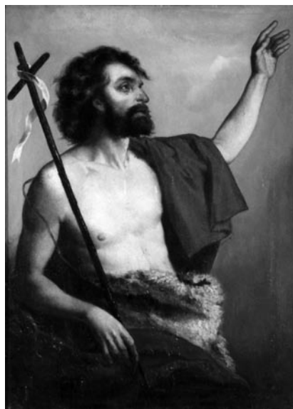
9 pav. I. Jasinskis. „Šv. Jonas Krikštytojas“, 1874–1877 (Kudirkos Naumiesčio bažnyčia). V. Balčyčio nuotr., 2004

Slavikų bažnyčios 1896 m. inventorius. Ar. Ėm. I. T. 482 (lapai nenumėruoti); Slavikų bažnyčios 1890 m. vizitacijos aktas. Ar. Ėm. II. T. 158. K. 1–1v; Strimaitis, V. Slavikai (mašinarštis). VUB RS. F. 187. B. 1318. L. 13, 34; Paminklų sąrašas: 752 (DV 2619); Vasiliūnienė, D. Paveikslai „Švč. Mergelė Marija Belaisvių Vaduotoja“, „Švč. Mergelė Marija Škaplierinė“, „Šv. Ona su Švč. Mergele Marija ir šv. Joakimu“. LSD. T. I. Kn. VI. D. II: 356–362, il. 271.