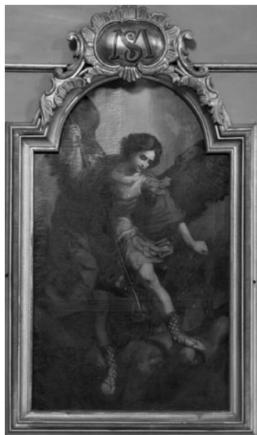
11 pav. J. Mašiniskis. „Šv. Arkangelas Mykolas“, 1873–1874 (Griškabūdžio bažnyčia). V. Balčyčio nuotr., 2004

I. 24. Švč. Mergelė Marija Škaplierinė. 1890 m. Drobė, aliejus, 85 × 55.