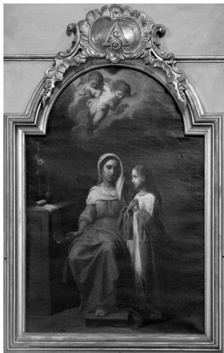
2 pav. L. Biedronskis. „Šv. Ona (Švč. Mergelės Marijos mokymas)“, 1874 (Griškabūdžio bažnyčia). V. Balčyčio nuotr., 2004

I. 2. Šv. Ona (Švč. Mergelės Marijos mokymas). Florencija. 1874 m. Drobė, aliejus, 133,5 × 89 (2 pav.).