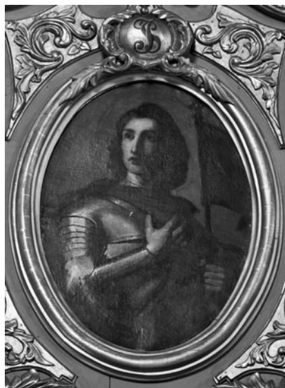
19 pav. A. Stšaleckis. „Šv. Jurgis“, 1873–1874 (Griškabūdžio bažnyčia). V. Balčyčio nuotr., 2004

Janonienė, R. Paveikslas „Šv. Jurgis“. LSD . T. I. K. VI. D. I: 189–190, il. 118; Majdowski 1993 (parduotų paveikslų sąrašo Nr. 81).