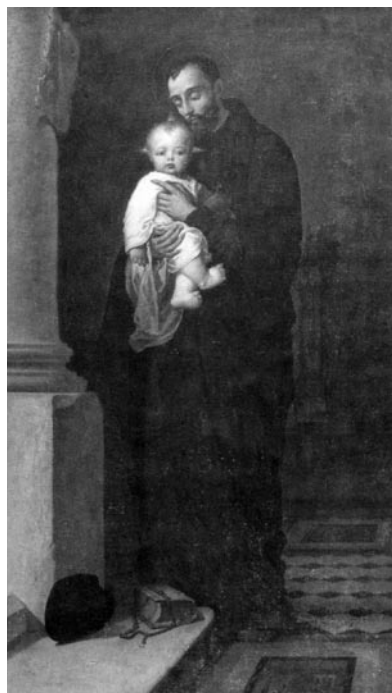
3 pav. J. Buchbinderis. „Šv. Kajetonas“, 1894 (Šventėžerio bažnyčia). V. Balčyčio nuotr., 1997

Signuotas apačioje dešinėje: „ Malo: / r. 1873 / odnowio(ny) / r. 1897 / M. Buczyński “ (tapytas 1873 m.; atnaujintas 1897 m. M. Bučinskio).