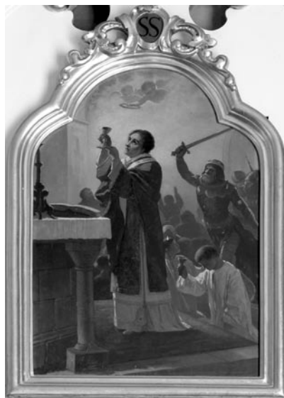
13 pav. K. Mireckis. „Šv. Stanislovo mirtis“, apie 1890 (Slavikų bažnyčia). V. Balčyčio nuotr., 2005

Slavikų bažnyčios 1896 ir 1899 m. inventoriai. Ar. Em. I. T. 482 (lapai nenumeruoti); Slavikų bažnyčios 1890 m. vizitacijos aktas. Ar. Em. II. T. 158. K. 1 ; Strimaitis, V. Slavikai (mašiniraštis). VUB RS. F. 187. B. 1318. L. 12 ; Vasiliūnienė, D. Paveikslas „Šv. Stanislovo mirtis“. LSD. T. I. Kn. VI. D. II: 364–366, il. 275.