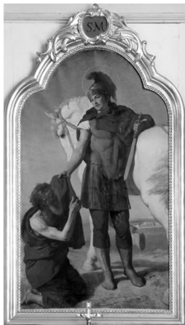
5 pav. V. Gersonas. „Šv. Martynas“, 1890 (Slavikų bažnyčia).