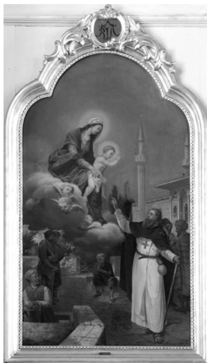
10 pav. A. Malinovskis. „Švč. Mergelė Marija Belaisvių Vaduotoja“, 1890 (Slavikų bažnyčia). V. Balčyčio nuotr., 2005