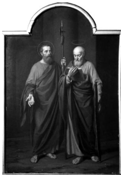
14 pav. A. Mużynovskis. „Šv. Simonas ir Judas Tadas“, 1873 (Kaimelio bažnyčia). A. Petrašiūno nuotr., 2004

Majdowski 1993 (parduotų paveikslų sąrašo Nr. 63); Stankevičienė, R. Paveikslai „Šv. Jurgis“, „Apsilankymas“ ir „Šv. Simonas ir Judas Tadas“. LSD. T. I. Kn. VI. D. I: 380–383, il. 275–276.