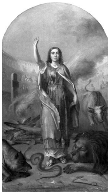
6 pav. A. Glembockis. „Šv. Teklė“, 1858–1867 (Rudaminos bažnyčia). V. Balčyčio nuotr., 1997

KROKIALAUKIO bažnyčia, titulinis didžiojo altoriaus paveikslas. Vasiliūnienė, D. Paveikslas „Jėzaus Atsimainymas“. LSD . T. I. Kn. V: 203–205, il. 118.