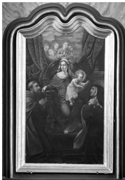
20 pav. F. Tegacas. „Švč. Mergelė Marija Škaplierinė“, 1878 (Kudirkos Naumiesčio bažnyčia). V. Balčyčio nuotr., 2004

Kudirkos Naumiesčio bažnyčios pajamų-išlaidų knyga, 1878–1890 m. LNB RS. F. 130–1844. L. 126v ; Račiūnaitė, T. Paveikslas „Švč. Mergelė Marija Škaplierinė“. LSD . T. I. Kn. VI. D. I: 496–497, il. 376; Majdowski 1993 (parduotų paveikslų sąrašo Nr. 158).