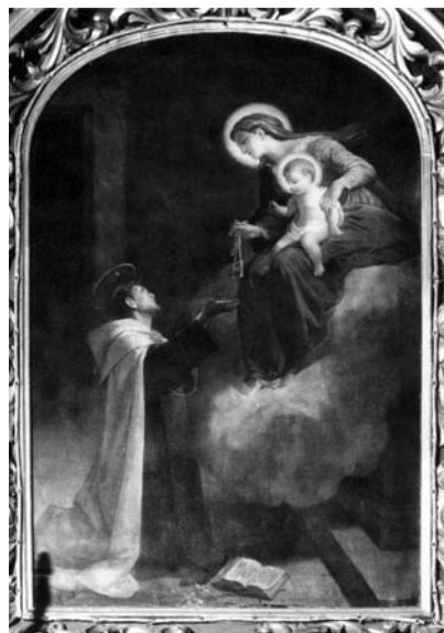
23 pav. P. Šidovskis. „Švč. Mergelė Marija Škaplierinė“, 1897 (Krosnos bažnyčia). V. Balčyčio nuotr., 1997

Słownik artystów... T. V. 1993: 199; Vasiliūnienė, D. Paveikslai „Šv. Izidorius“ ir „Šv. Jėzaus Krikštas“. LSD . T. I. Kn. VI. D. I: 305–309, il. 212.