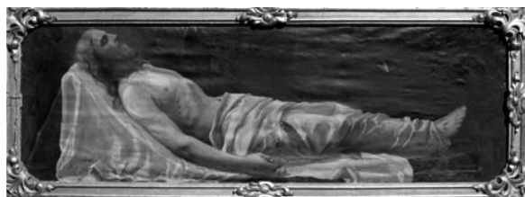
16 pav. V. Piechovskis. „Jėzus karste“, 1873–1874 (Griškabūdžio bažnyčia). 2004

Majdowski 1993 (parduotų paveikslų sąrašo Nr. 53); Smilingytė-Žeimienė, S. Paveikslas „Jėzus karste“. LSD. T. I. Kn. VI. D. I: 202–203, il. 130.