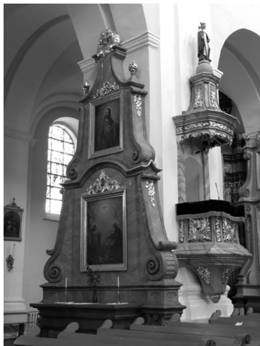
1 pav. Kudirkos Naumiesčio bažnyčios interjeras.