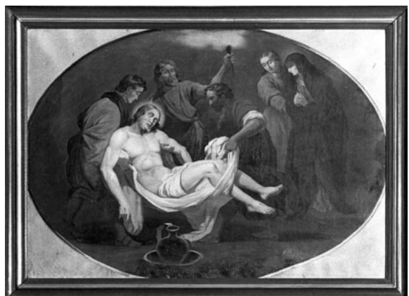
17 pav. J. T. Polkovskis. XIV Kryžiaus kelio stotis, 1884 (Prienu bažnyčia). V. Balčyčio nuotr., 1999

Paminklų sąrašas : 516 (DR 859); Stankevičienė, R. Kryžiaus kelio stotys. LSD. T. I. Kn. I: 295–298, il. 161–162.