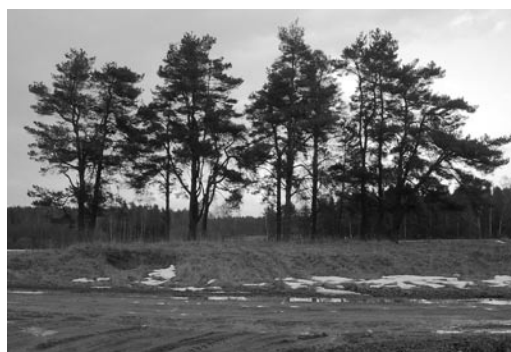
2–3 pav. „Kryžių kalno“ vaizdas, 2009 03 06.