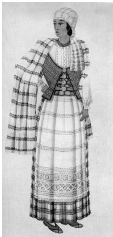
5 pav. „Trakų apylinkės moteris“ ( Lietuvių moterų tautiniai drabužiai 1939)

Knyga pirmą kartą pateikė nuoseklų, visą Lietuvą apimančią regioninių kostiumų vaizdą. Tiesa, regionų ir netgi atskirų vietovių kostiumai kai kurių autorių buvo nustatyti bei aprašyti ir anksčiau, tačiau dažniausiai tai būdavo grynai etnografinio pobūdžio informacija, liečianti nedidelę konkrečią apylinkę. Paprastai tokiems bandymams trūkdavo tikslumo, išbaigtumo ir informacijos apibendrinimo, būtino