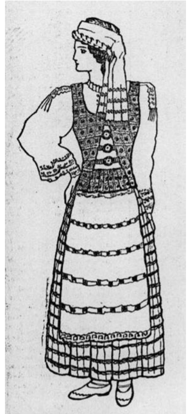
3 pav. „Trakų apylinkės moteris“. A. Tamošaičio piešinys ( Jaunasis ūkininkas . 1938. 7: 103)

1937 m. Jaunojoje kartoje paskelbta serija straipsnių, kurių kiekvienas buvo skirtas vienos etnografinės srities moterų ir merginų tautiniam kostiumui 29 . Pateikti aukštaičių, žemaičių, dzūkių, kapsių ir Trakų apylinkės tautiniai drabužiai (3 pav.).