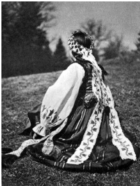
6 pav. Zanavykė mergina ( Lietuvių moterų tautiniai drabužiai 1939: 70)