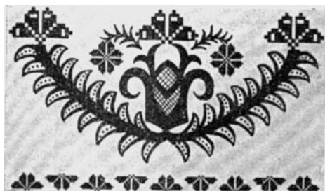
7 pav. Marškinių perpetės raštas ( Jaunoji karta 1938. 46: 935)