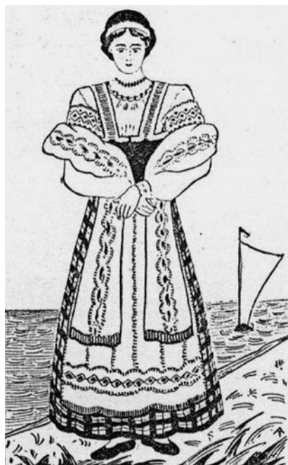
4 pav. „Klaipėdietė tautiškais drabužiais“. A. Tamošaičio piešinys ( Jaunasis ūkininkas . 11: 164)

1938 m. dar išsamesnių straipsnių serija buvo publikuota Jaunajame ūkininke 30 . Pirmasis straipsnis „Lietuvių tautiniai drabužiai“ aptaria bendruosius lietuvių moterų tautinių drabužių bruožus ir jų atkūrimo problemas. Jo turinys turi daug bendro su būsimos knygos pratarne ir įvadiniais straipsniais. Jame, priešingai negu 1935 m. rašinyje, abejojama stilizacijos reikalingumu 31 . Kiti straipsniai skirti atskirų regionų arba smulkesnių teritorinių darinių, apylinkių, drabužiams: aukštaičių, Biržų apylinkės, Trakų apylinkės, žemaičių mergaičių, žemaičių moterų, dzūkių, kapsių, zanavykių, Klaipėdos krašto (4 pav.).