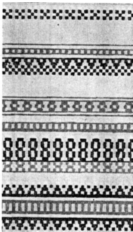
8 pav. Prijuostės raštai ( Jaunasis ūkininkas . 1938. 11: 164)

minio audeklo paprastai būdavo kasdienės ir nedailios. Daugybė XIX a. fabrikinės galanterijos dirbinių naudota galvos papuošalams ir kitų drabužių apdailai. Fabrikinė tekstilė Tamošaičio akimis buvo dvigubai ydinga: ne tik ne rankų darbo, bet dar dažnai tokia pat arba panaši į naudotą kitų tautų.