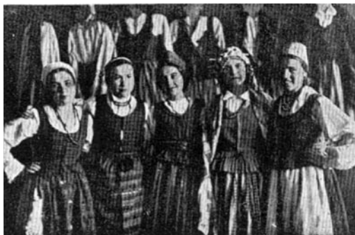
2 pav. Žemės ūkio rūmų senovinių drabužių rinkiniai ( Moteris . 1938. 3: 39)