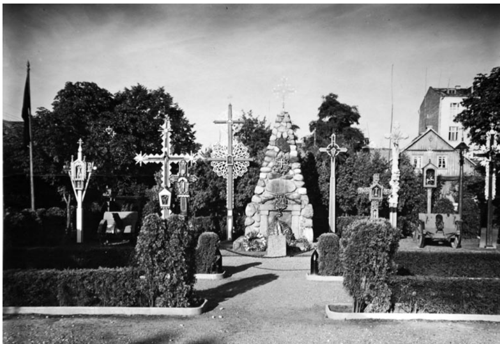
1 pav. Paminklas „Žuvusiesiems už Lietuvos laisvę“ ir kryžiai Karo muziejaus sodelyje, apie 1935–1937