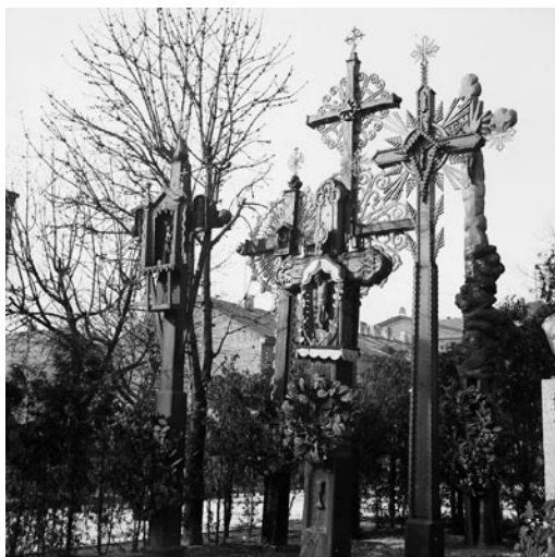
2 pav. Kryžiai muziejaus sodelyje, XX a. 4-ojo deš. pab. Iš kairės: 1 – atvežtas iš Perlojos, 2 – katalikiškojo jaunimo, 3 – iš Taujėnų apylinkių, 4 – pagamintas pagal projektą Nr. 32, 5 – dirbdintas P. Mikutaičio, 6 – išdrožtas V. Svirkio.

pradžioje, piramidės pusę. Ieškota geresnės kompozicijos, dermės su aplinka, kol pasiektas rezultatas, kurį architektūros istorikė Jolita Kančienė apibūdina kaip kryžių „giraitę“ (2, 3 pav.), stilistiškai nederančią prie modernios muziejaus architektūros 15 .