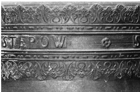
5 pav. Siaurojo akanto lapų frizo fragmentas. Varpas, 1800 (Pakražančio bažnyčia). 1988