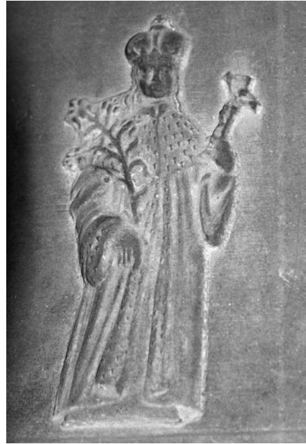
3 pav. Varpas, 1786. Reljefas „Šv. Kazimieras“. (Varnių Šv. Petro ir Pauliaus bažnyčia). A. Ivinskio nuotr., 2004

Remiantis šiomis literomis, pavyko nustatyti ir Varnių liejykoje naudotą trečio dydžio ornamento juostą (4, 5 pav.), skirtą mažiausiems varpams. Ją taip pat sudaro akanto lapeliai, tačiau visai mažičiai (h 2,4 cm), tarp jų nebėra vynuogių kekių, tik miniatiūrinės rozetės. Seniausias išaiškintas varpas su šio modelio ornamento juosta datuotas 1787 metais. Jį pavyko aptikti buvusiam Vilniaus paveikslų galerijos karilione, 1967 m. sovietų valdžios nurodymu sukomplektuotame iš uždarytų bažnyčių varpų, atgabentų iš visos Lietuvos. 1787 m. varpas į šį rinkinį pateko iš sovietmečiu neveikusios Varnių Šv. Aleksandro bažnyčios, o 2002 m. buvo sugrąžintas į Varnius 13 .