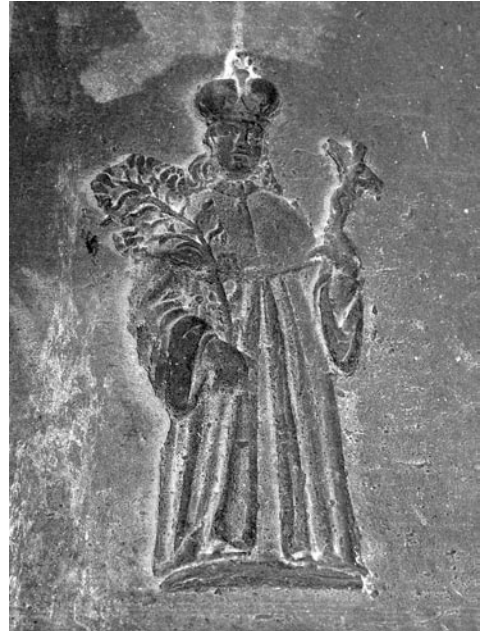
6 pav. J. Delamarso lietas laikrodžio varpas, 1673. Reljefas „Šv. Kazimieras“ (Vilniaus arkikatedros varpinė).

Baigiant šią trumpą Varniuose nuliedintų varpų puošybos apžvalgą reikia pabrėžti, kad ankstyvieji Varnių liejyklos varpai pasižymi