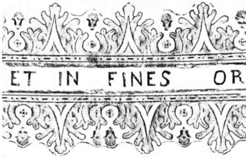
2 pav. Plačiojo akanto lapų frizo fragmentas. Varpas, 1789 (Joniškio bažnyčia). G. Žalėno frotaziinis atspaudas