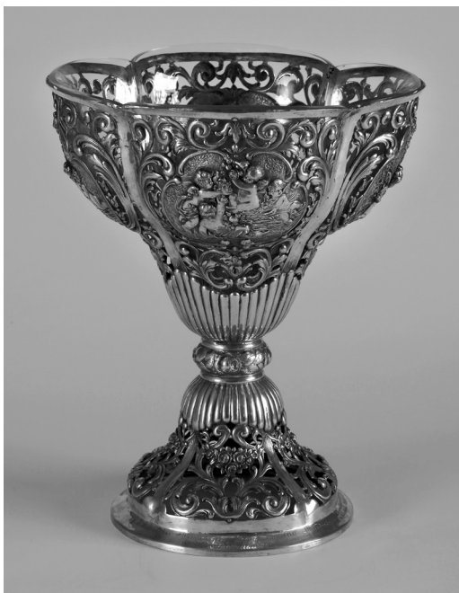
12 pav. Vaza. Lietuvos Respublikos Prezidento Antano Smetonos pereinamoji taurė (Kauno teniso klubo 1931 09 17 surengtas tarptautinis teniso turnyras Kaune). „Wilhelm Weinranck & Fritz Shmidt“ firma, Vokietija. Sidabras, štam pavimas, graviravimas; stiklas. H-36, 7; Ø-30