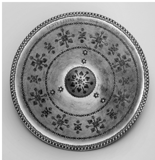
9 pav. Dekoratyvinė lėkštė. Estijos futbolo sąjungos garbės dovana. Dail. Otto Tammeraid. Talinas, 1939. Varis; kalstymas, lenkimas, sidabravimas, raižymas. H – 6,7; Ø – 29,5 (ČDM, Rimantės Ropytės nuotr.)