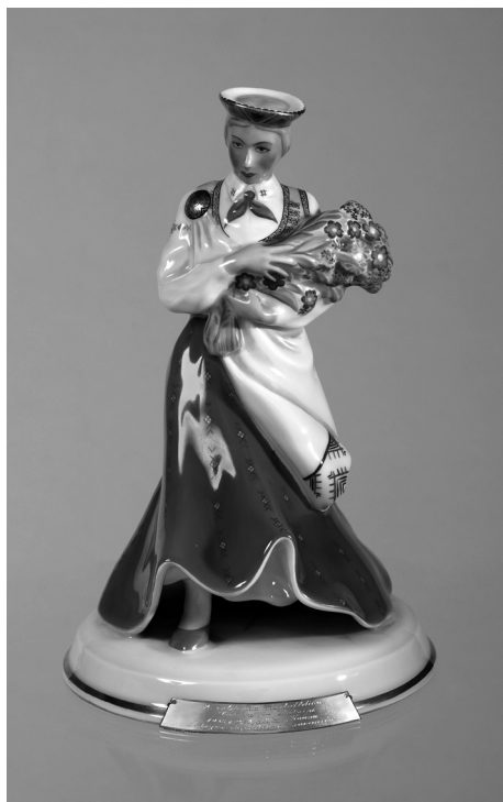
2 pav. Skulptūrėlė „Latvė“. Latvijos lengvosios atletikos sąjungos garbės dovana. Rygos M. Kuznecovo porceliano f-kas, 1938. Autorius nežinomas. Dekoratorė Lidija Barmina. 24,7 × 16,5 × 16

originalūs, meniški nedidelėmis serijomis leisti fabrikiniai dirbiniai. Kai kurie prizai yra tiesiog dailūs, brangūs, kokybiškai pagaminti indai, pavyzdžiui, vazos, kurių analogai naudoti ir buityje. Tokiais atvejais tik įrašai krištolo, porceliano vazų ir statulėlių (2 pav.), dekoratyvinių lėkščių, odinių aplokų paviršiuje ar prie jų pritvirtintose sidabro lentelėse bei apkaustuose liudija, jog tai konkrečioms sporto varžyboms skirta dovana. Prizų ir jų funkciją atlikusių dekoratyvinių dirbinių ar indų meninė kokybė patvirtina, kaip smuko šiuolaikiniai amatai ir pakito mūsų daiktinė aplinka. Tarpukario sportiniai prizai šiuolaikiniame kontekste būtų suvokiami kaip išskirtiniai prabangos daiktai. Tokio meninio lygio apdovanojimai šiais laikais yra visiška retenybė ir galėtų būti gretinami tik su valstybių vadovų reprezentacinėmis dovanomis.