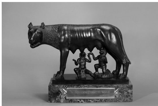
3 pav. Antikinės skulptūros „Kapitolijaus vilkė“ kopija. Romos gubernatoriaus dovana I Europos moterų krepšinio pirmenybių II vietą laimėjusiai komandai. Roma, 1938. Bronza, liejyba; marmuras, šlifavimas