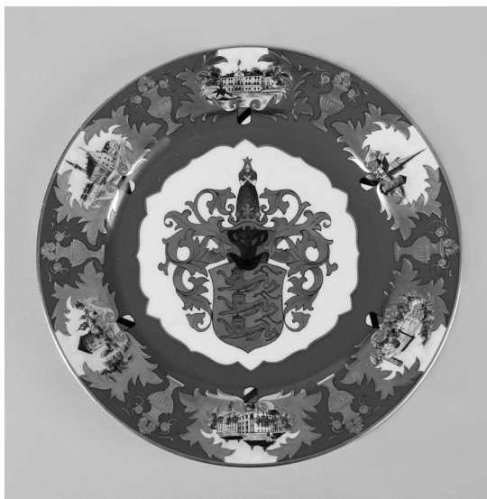
7 pav. Dekoratyvinė lėkštė. Estijos futbolo federacijos garbės dovana. Pagaminta Nicol Langebraun porceliano dekoravimo fabrike. Talinas, 1933. Porcelianas; dekolis, tapyba. H – 2,5 (ČDM, Rimantės Ropytės nuotr.)