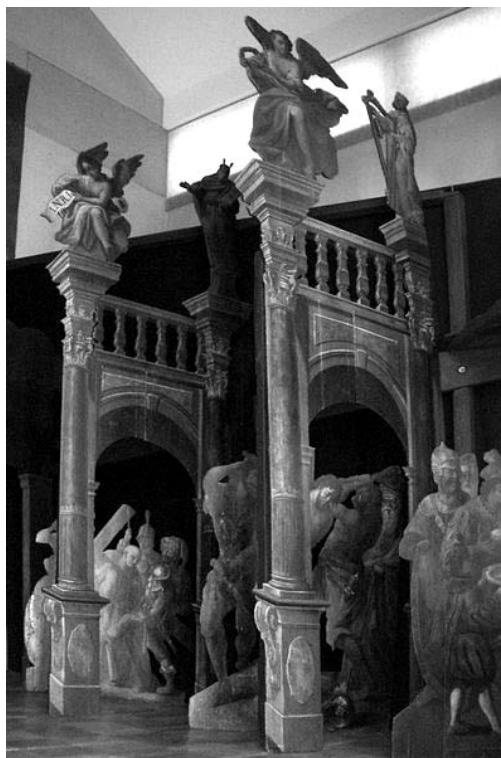
9 pav. Šventojo kapo koplyčios dekoracijų fragmentas. 1763. Altshauseno bažnyčia

vartais“ (Gelvonų bažnyčia) 43 ; „staliaus darbo su penkiais tapytais vartais“ (Kavarsko bažnyčia) 44 ; „staliaus darbo su trimis tapytais vartais“ (Videniškių bažnyčia) 45 ; „penkių pakopų su keturiais vartais ir kape staliaus darbo Viešpaties Jėzaus atvaizdu“ (Lenkimų bažnyčia) 46 ; „penkiais tapytais vartais“ (Kartenos trečiosios altarijos bažnyčia) 47 ; „virš Kristaus kapo keturi tapyti rėmai“ (Raguvos bažnyčia) 48 ir pan. Šios kompozicijos veikiausiai buvo panašios į Altshauseno bažnyčios Šventojo kapo koplyčios dekorą, tik gerokai mažesnės – centre buvo patalpinama arka su Kristaus kapu, o iš šonų po vieną ar du vartus (6, 9 pav.). Žodžiu vartai apibūdinami ne vien portalai, bet ir arkų įrėminimai, vaizduojantys uolas ar dangaus skliautą bei iliuziškai tapytos arkos. Kaip atrodė tokia erdvėje išdėstyta Kristaus kapo dekoracija galima suprasti iš vėlesnio 1821 m. įrengto Nevarėnų bažnyčios Kristaus kapo aprašymo. Šioje bažnyčioje klebonas Tadas Knapskis pastatė specialią patalpą (zakristiją): joje „dvigubi vartai, ant geležinių vyrų, prie jų ant drobės nutapyti du kariai. Aplinkui [pakabintos] dvidešimt viena alavinė lempa, sustatytos keturios alie-