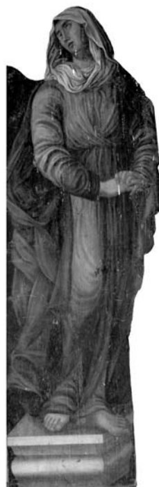
2 pav. Kontūrinis paveikslas „Švč. Mergelė Marija Sopulingoji“. 2010

Kaip buvo minėta, Veiviržėnų bažnyčios palėpėje buvo rasti ant medžio plokštės iliuziškai tapyti kontūriniai paveikslai, kompozicijų dalys ir architektūros fragmentai: tai kontūrinis paveikslas „Švč. Mergelė Marija Sopulingoji“ (aukštis – 206,5 cm; plotis – 71,7 cm); paveikslo „Šv. Jonas evangelistas“ fragmentas (išliko pusė figūros, apatinė dalis; aukštis – 186,5 cm; plotis – 56,2 cm); skydo dalis su Agnus Dei kompozicija (aukštis – 75 cm; plotis – 245 cm); dvi skydo dalys su kompozicija „Adoruojantys angelai“ (pirmosios aukštis – 84,5 cm; plotis – 289 cm; antrosios aukštis – 41 cm; plotis – 175 cm); kontūrinė Angelo figūra (aukštis – 44 cm; plotis – 42 cm); karnizo fragmentas (aukštis – 27,5 cm; plotis – 116 cm); taip pat supjaustytos lentos su iliuziškai tapytais architektūros fragmentais, iš kurių sukaltas tabernakulis (2–4 pav.). Pagal išmatavimus, vienodą pagrindą, kontūro linijas ir tapybos pobūdį atrodė, kad visos dalys priklausė vienam įrenginiui, bet sujungti atskiras dalis buvo gana sudėtinga. Skydo dalis, vaizduojanti karnizą ir nišos apvadą su Agnus Dei atvaizdu, panašėjo į retabulo