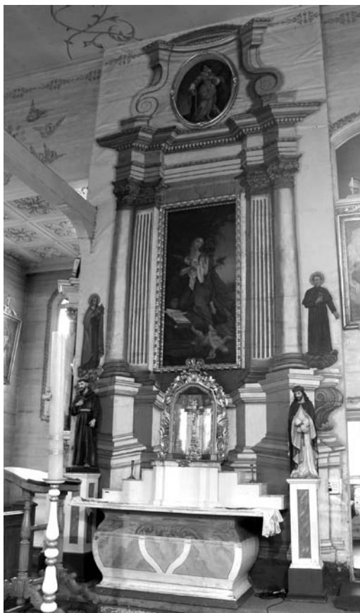
1 pav. Veiviržėnų bažnyčios Šv. Marijos Magdalietės altorius. A. Petrašiūno nuotr., 2010

Iki mūsų dienų išliko vienas Šv. Marijos Magdalietės iliuziškai tapytas altorius, sukurtas kiek vėliau nei minėtieji (1 pav.) 16 . XIX a. 2 deš. dokumentuose pažymima, kad „optiškai tapytas“ altorius įrengtas prie zakristijos durų 17 . 1828 m. rašoma, kad pirmame tarpsnyje Šv. Marijos Magdalietės paveikslas su staliaus darbo paauskuotu rėmu. Iš šonų nutapytos kolonos, tarp jų pa-vaizduotos Šv. Jeronimo [dešinėje – A. G. ], kairėje – Šv. Ignaco statulos 18 . Mensa staliaus darbo, tapyta 19 . Vėlesniuose XIX a. vid. dokumentuose jo išvaizda apibūdinta itin lakoniškai, paminimi kabantys pirmame tarpsnyje šv. Marijos Magdalietės, antrame – šv. Barbaros atvaizdai 20 . XIX a. 8 deš. abu altoriaus paveikslai pakeisti naujais, titulinį Šv. Marijos Magdalietės Magdalenos atvaizdą 1872 m. nutapė meistras iš Rygos Th. Tichejevas 21 . Šio atvaizdo autorinė kartotė kabo Grūstės kapinių koplyčios altoriuje 22 . Dailininkui gali būti priskirtinas ir antro tarpsnio šv. Barbaros paveikslas. Retabulas ne kartą pertapytas, matyti, kad atnaujintojas supaprastino puošmenas, taip pat užtapė tarp kolonų buvusias iliuziškai tapytas šventųjų Jeronimo ir Ignaco statulas. Veikiausiai 1936 m. perdažant bažnyčią 23 buvo nutapytos Šv. Jono Bosko ir Šv. Kūdikėlio Jėzaus Teresės figūros.