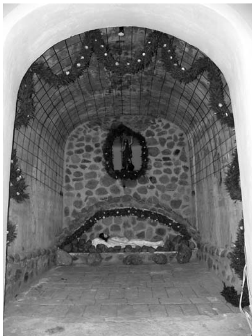
8 pav. Kristaus kapo koplyčia. Šumsko bažnyčia. D. Baltrano nuotr., 2008

XVIII a. II pusės – XIX a. I ketv. Kristaus kapas minimas dažnoje parapiinėje bažnyčioje. Vėlyvojo baroko laikotarpiu paplito ant staliaus darbo medžio plokščių tapytos dekoracijos, kartais joms panaudota ir drobė, pvz., Anykščių bažnyčioje Kristaus kapo „viena dalis tapyta ant storlenčių lentų, kita – ant lino drobės“ 41 . Jas papildė įvairūs tapyti ir skulptūriniai dailės dirbiniai 42 . Iš aprašų galima suprasti, kad Kristaus kapo įrenginiai buvo gana sudėtingos struktūros, juos sudarė keleletas vartų – „Viešpaties kapas su keturiais tapytais