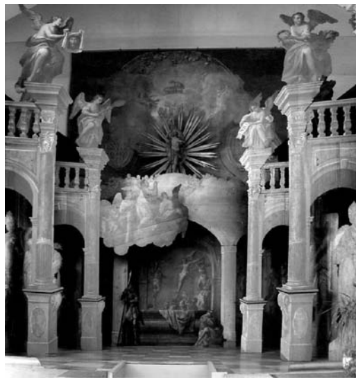
5 pav. Šventojo kapo koplyčios dekoras. 1763. Altshauseno bažnyčia