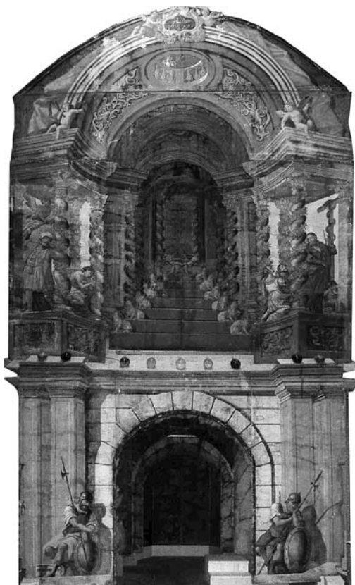
6 pav. J. I. Schilling. Kristaus kapo dekoracija. 1757. Rottach-Egern bažnyčia. J. Juozėnienės schemas, 2012