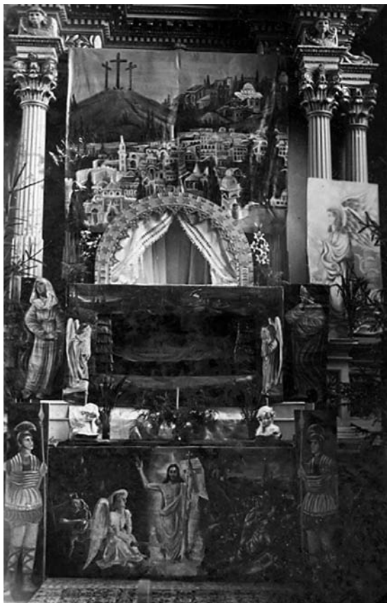
13 pav. Kristaus kapo dekoracija. Kvedarnos bažnyčia. XX a. 3–4 deš.

Dar vienas įdomus, retos ikonografijos ant drobės tapytas paveikslas, rastas toje pačioje Veiviržėnų bažnyčios palėpėje (14 pav.). Paveikslas perkirtas ir prisiūtas ant procesijų vėliavos. Jame vaizduojami pragarai, žemės žiotyse Senojo Testamento personažai, pirmame plane klūpi Adomas ir Ieva su obuoliu, už jų Nojus su laivu, jo žmona ir kiti teisieji. Pagal ikonografiją tai veikiausiai Kristaus Priskėlimo ir Nužengimo į pragarus paveikslo fragmentai. Šis siužetas itin populiarus stačiatikių ikonų tapyboje, bet Lietuvos katalikiškoje dailėje lig šiol neaptiktas. Tikėtina, kad paveikslas buvo kabinamas Kristaus kapo dekoracijos apatinėje dalyje. Didžiojo šeštadienio liturgijoje, laukiant Priskėlimo, buvo apmąstomi Išganytojo kentėjimai, mirtis bei nužengimas į pragarus, išvadavimas iš gimtosios nuodėmės. Šis paveikslas nutapytas XIX a. I pusėje, bet kito meistro nei pagrindinė dekoracija. Taigi Veiviržėnų bažnyčios Kristaus kapo ikonografinė programa, naudoti simboliai panašūs