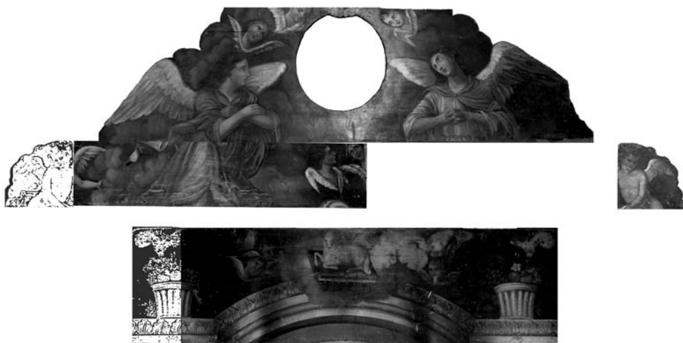
3 pav. Iliuziškai tapyto retabulo fragmentas. J. Juozėnienės montažas, 2012