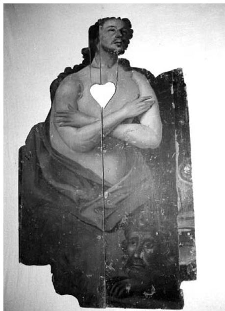
10 pav. Kontūrinis paveikslas „Danielius liūtų duobėje“. XVIII a. III ketv. Šiluvos bažnyčia.