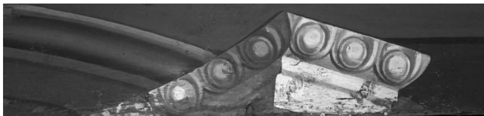
4 pav. Iliuziškai tapytas karnizo fragmentas. A. Petrašiūno nuotr., 2010

fragmentą, pagal ikonografiją tradiciškai priskirtiną didžiajam altoriui. Šią prielaidą teko atmesti, nes Veiviržėnų bažnyčios archyvuose minimas staliaus darbo didysis altorius 24 . Švč. Mergelė Marija Sopulingoji ir Šv. Jonas evangelistas tradiciškai priskiriami Nukryžiuojo kompozicijai, taigi šios figūros galėjo stovėti anksčiau minėtame šoniniame, iliuziškai tapytame Nukryžiuotojo altoriuje. Kontūrinė skydo dalis, vaizduojanti adoruojančius, ašarojančius angelus su viduryje įkomponuota ovaline išpjova, atrodė kaip Didžiosios savaitės apipavidalinimo dalis.