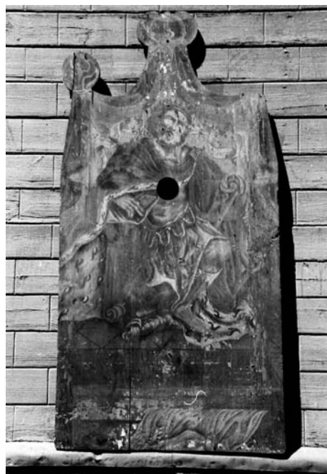
11 pav. Kontūrinis paveikslas „Karalius Dovydas“. XVIII a. III ketv. Semeliškių bažnyčia.