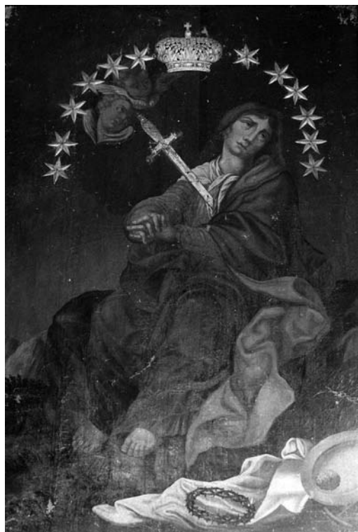
15 pav. Paveikslas „Švč. Mergelė Marija Sopulingoji“. Gargždės kopyčia. 1989

kaip Pfaundlerio Patscho bažnyčios dekoracijoje, kurioje Dievo žmonijos Išgelbėjimo planas parodomas per pirmųjų žmonijos tėvų Adomo ir Ievos nuopolį ir Dievo Sūnaus atperkamąją auką (7 pav.).