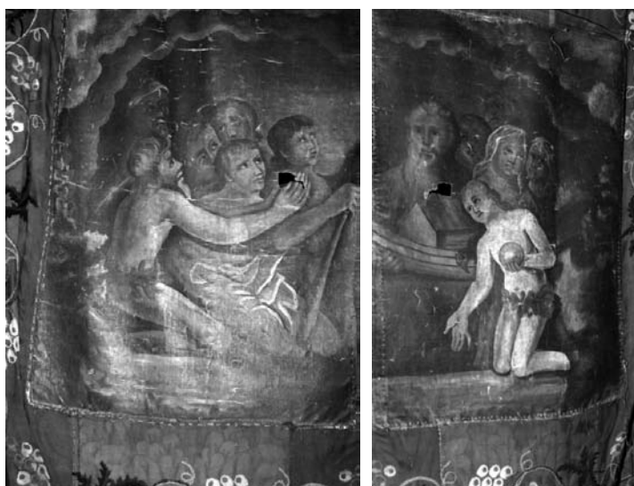
14 pav. ir 14.1 paveikslo „Pragarai“ fragmentai. XIX a. I p. Veiviržėnų bažnyčia. A. Petrašiūno nuotr., 2010