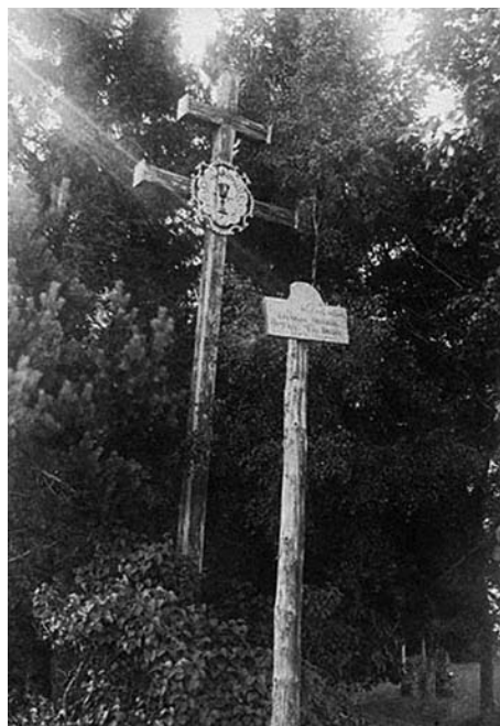
2 pav. Kryžius, statytas 1896 m., Zaviesiškių dvarvietėje (Anykščių r.). A. Varno nuotr., 1924. LDM LF-557/1