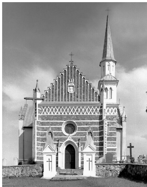
1 il. Różanka, kościół parafialny. Widok fasady. Fot. P. Jamski, 2003

Kościół został zbudowany na planie krzyża. Jednonawowy, trójprzęsłowy korpus wzbogacono parą wymienionych kaplic, do wydzielonego prezbiterium zamkniętego trójbocznie przylega od północy kwadratowa piętrowa zakrystia. Szeroki otwór w ścianie tęczowej zamyka łuk półkolisty, kaplice otwierają się do nawy półkolistymi arkadami o sfazowanych ościeżach. Od zachodu wznosi się murowany trójprzęsłowy chór muzyczny, pod nim kruchta, skomunikowana z wieżą. Ściany nawy podzielono uproszczonymi zdwojonymi pilastrami. Sklepienie przekrywa kolebka na gurtach, w prezbiterium z lunetami. Pod kościołem