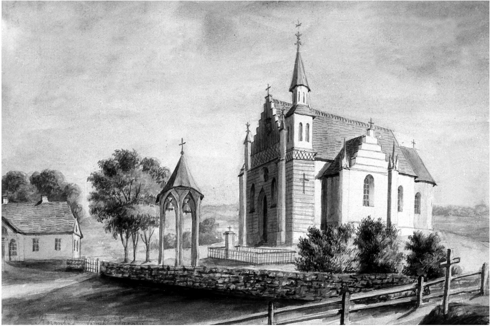
6 il. Różanka. Widok ogólny od pd. zach. z dzwonnicy i plebanią. Rys. N. Orda, ok. 1875. NID (Narodowy Instytut Dziedzictwa), nrg. 7265/A. Repr. Z. Malinowski, 1972

podziałach horyzontalnych, z dwiema niszami w ozdobnych obramieniach, dziś pustymi, lecz pierwotnie mieszczącymi rzeźby patronów kościoła – ŚŚ. Piotra i Pawła. Rolę głównego elementu przestrzennego, jak dzisiaj, pełniła wieża, zsunięta na prawy skraj. Pozostałe elewacje nie uległy większym zmianom, gdyż wobec zaniechania przekształcenia okien (projekt przewidywał ostrołukowe, z maswerkami i dwustrefowym podziałem na małe ostrołukowe kwatery), gotycyzacja sprowadziła się do nadania szczytom kaplic formy schodkowej, co wobec rezygnacji z przebicia ostrołukowych okien w ścianach bocznych, nie wystarczyło na uzyskanie wyrazistej zmiany stylowej. Za korzystne odstępstwo od projektu należy uznać wprowadzenie efektownej kamiennej okładziny elewacji frontowej, a także zachowanie starej zakrystii, której z niezrozumiałych względów nie ma na rysunku przedstawiającym rzut budowli (zapewne według planu miała zostać usunięta).