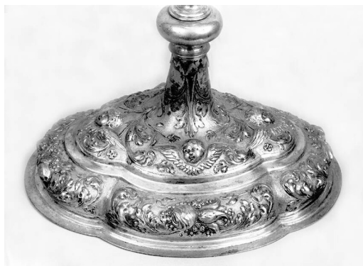
7 il. Różanka. Monstrancja, I poł. w. XVIII. Detal.

Notowana w dokumentach od roku 1843 została pozyskana z kościoła karmeliotów w Lidzie, zamkniętego po kasacie klasztoru (1832). Wykonano ją w 1 połowie XVIII wieku ze złoconego srebra: stopę ozdobiono repusowaną dekoracją akantowo-kwiatową oraz uskrzydłonymi główkami aniołków (il. 7), gruszkowy nodus rytym ornamentem taśmowym i wicią roślinną, okrągłą puszkę otoczył wieniec obłoków z uskrzydłonymi główkami anielskimi, półpostacią Boga Ojca w trójkątnym nimbie oraz gołębicą Du-