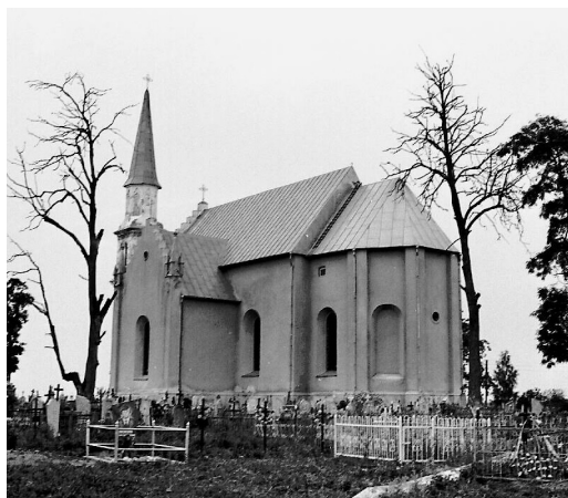
3 il. Różanka, kościół parafialny. Widok od prezbiterium.

kryją się krypty – dwie w prezbiterium i pojedyncze w kaplicach.