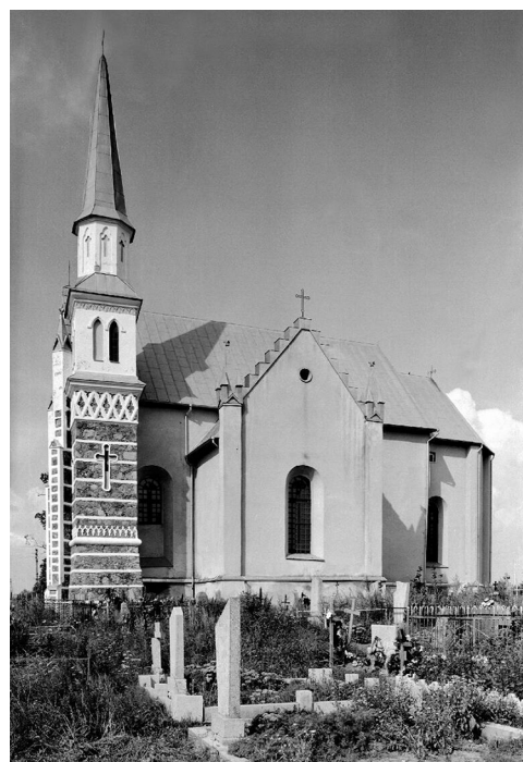
2 il. Różanka, kościół parafialny. Widok od pd. Fot. P. Jamski, 2003