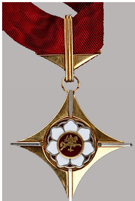
1 pav. Auksinis scenos kryžius