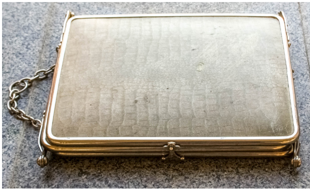
6–7 pav. Grimo veidrodis. XX a. I pusė, Rusija. Saugomas Lietuvos teatro, muzikos ir kino muziejuje, LTMKM AD 10842