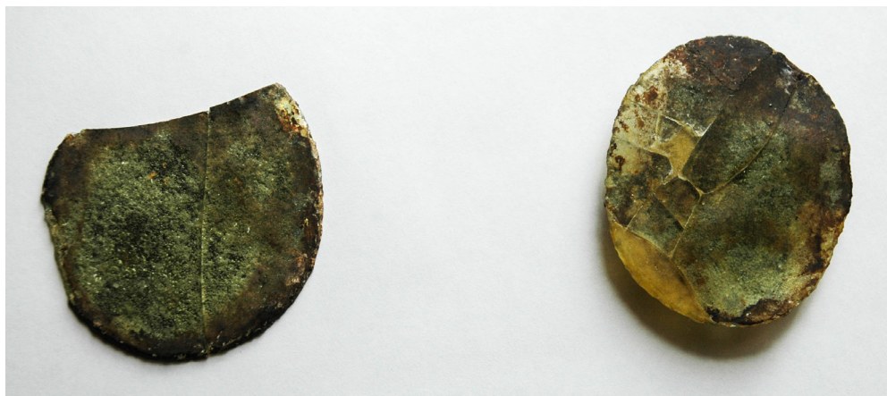
3 pav. XVII a. stikliniai veidrodėliai, aptikti Skėrių kapinyne, Mažeikių r. V. Valatkos 1972 m. tyrinėjimai. Iš: Mažeikių muziejus , GEK MM 3634 A 311, GEK MM 3635 A 312.

dėžutės, kurios abi – viršutinė ir apatinė – dalys būtų išlikusios. Vientisos veidrodėlio dėžutės pavyzdžių matome Ingeborg Krueger straipsnio iliustracijose 29 .