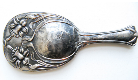
9 pav. XX a. pr. art nouveau stiliumi dekoruotas veidrodėlis, saugomas Rokiškio krašto muziejuje, RKM 46192