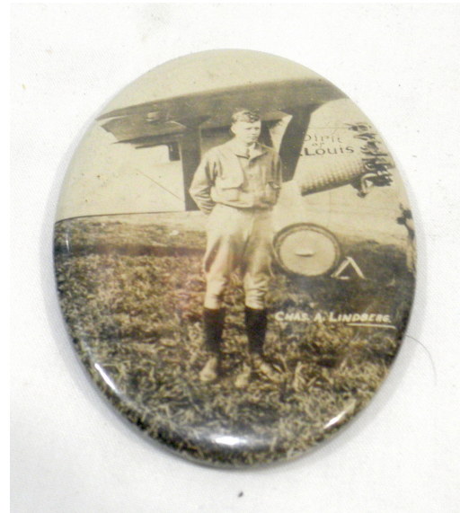
5 pav. Kišeninis veidrodėlis su amerikiečių lakūno Charlo Augusto Lindbergh atvaizdu. Prieiga per internetą: http://www.celluloidmirrors.com/types-of-pocket-mirrors/

Tualetinių veidrodžių pasirinkimas minėtame prekių kataloge kur kas gausnesnis nei kišeninių – siūloma dvidešimt keturi veidrodėlių tipai. Dominuojanti forma – ovalas, kiek mažiau keturkampių, keletas apskritimų ir vienas pasagos formos. Brangiausias kataloge yra pastatomas tualetinis veidrodis, sudarytas iš trijų tarpusavyje sujungtų ovalo formos dalių. Tokio tipo veidrodžiai buvo populiarūs – sustatyti kampu, jie atspindėdavo didesnio ploto vaizdą, todėl itin atitiko tualetinę paskirtį. Vienas ryškiausių pavyzdžių – grimo veidrodis, saugomas Lietuvos teatro, muzikos ir kino muziejuje (6–7 pav.). Šis veidrodis priklausė Lietuvos teatro aktorei Marijai Marcinkevičiūtei-