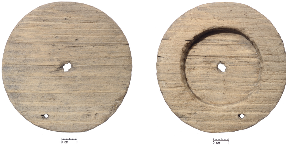
1–2 pav. XIV–XV a. veidrodžio dėžutės rėmelis, rastas Vilniaus žemutinės pilies Valdovų rūmų teritorijoje. E. Ožalo 2003 m. tyrinėjimai. Iš: Pilių tyrimo centras „Lietuvos pilyės“ , Md 54

dėžučių“. 24 Metalinius dirbinius klasifikavusi Elena Rybina išskiria du tipus: „futliarą“, kurio viršutinės ir apatinės dalių kraštai sandariai užsidaro, sudarydami kapsulę, ir dėžutę su atvirais kraštais 25 . Remdamiesi lietuviška istoriografija 26 , šiame darbe abu tipus vadinsime veidrodžių dėžute.