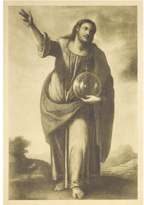
6 pav. Tiziano „Jėzus“. XVI a. Iš kn.: Vente à St. Moritz (Suisse) , 1913 m. Nr. 94

Holofernas“), Pietro Longhi („Kilmingos damos portretas“), Giambattista Tiepolo („Grupė šventųjų prie Madonos kojų“), Tiziano („Jėzus“ (6 pav.), Antonio da Correggio („Išminčių pagarbinimas“), Paolo Veronese („Vyro portretas“), Justo Sustermanso („Kardinolo iš Medičių portretas“, „Marija de Mediči“, „Karininko portretas“), Caravaggio („Šv. Agnesė“), Bernardo Strozzi („Šv. Cecilija“), Daniele Crespi („Šventojo ekstazė“, „Šventoji šeima“), Parmigianino („Madona“), Sebastiano Ricci („Apolonas: dienos alegorija“, „Diana: nakties alegorija“, „Karalius Saliamonas“), Scarsellini („Šv. Pranciškaus stebuklas“), Andrea Schiavone („Prozerpinos pagrobimas“), Gerbrando van der Eeckhouto („Merkurijus ir Argo“), Franso Snydero („Keturi kurtai“), Gaspardo Poussino („Rudens peizažas“), Canaletto („Venecijos vaizdas“), Giambattista Pittoni („Jėzus Emause“), Hanso Memlingo („Epizodai iš Šv. Martyno gyvenimo“), Jean-Auguste-Dominique Ingreso („Prometėjas“) ir daugybė kitų. Žinia apie kolekciją pasklido už Italijos ir Šveicarijos ribų: apie ją rašė Prancūzijos, Vokietijos bei Ispanijos kultūrinė spauda. Atskiro dėmesio sulaukė ir pavieniai rinkinio egzemplioriai, pavyzdžiui, ispanų žurnalo Mundo grafico korespondentas analizavo El Grecui priskirtą darbą „Švč. Mergelės karūnavimas“ (5 pav.), svarstė jo stilistines ypatybes ir tuo remdamasis priskyrė jį ankstyvajam dailininko kūrybos laikotarpiui 46 .