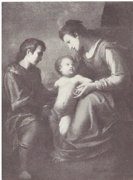
8 pav. A. del Sarto „Šventoji šeima“. XVI a. Iš kn.: Catalogo della vendita , 1920 m. Nr. 308