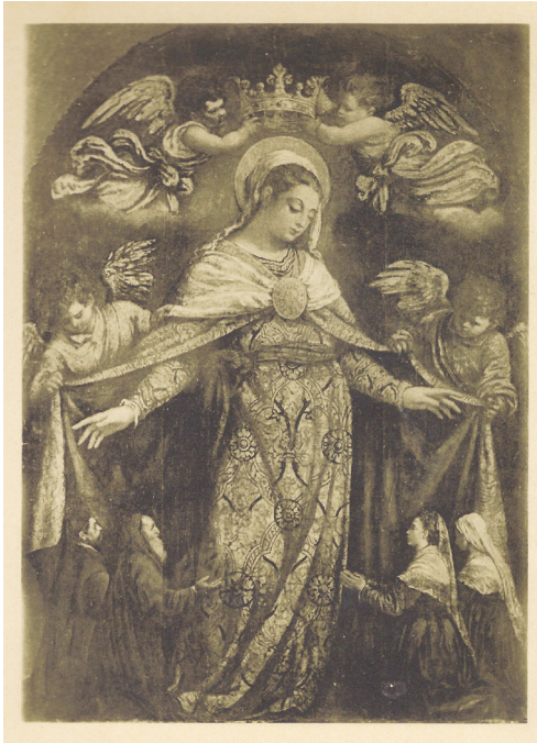
5 pav. El Greco „Švč. Mergelės karūnavimas“. XVI a. pab. Iš kn.: Vente à St. Moritz (Suisse) , 1913 m. Nr. 13