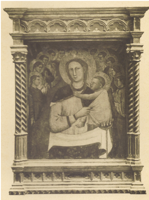
7 pav. J. di Paolo „Madona su kūdikiu ir angelais“. XIV a. Iš kn.: Vente à St. Moritz (Suisse) , 1913 m. Nr. 6