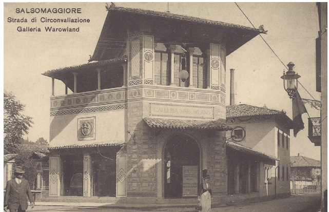
3 pav. „Galleria Warowland“ padalinys Salsomaggiore Terme kurorte. Atvirukas pagal A. Mattioli nuotrauką. XX a. pr. Asmeninė autorės kolekcija

Duktė pasakoja, kad tėvas nuolat gilino žinias savarankiškai – savaitgaliais kartu su vaikais lankė miesto įžymybes, muziejus ir galerijas, itin daug keliavo po pačią Italiją. Vis dėlto plačių užmojų entuziastas pats vienas nebūtų