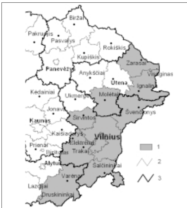
1 pav. Autoriaus analizuojama Rytų Lietuvos regiono teritorija (2000 m.): 1 – Rytų Lietuvos regiono teritorija, 2 – savivaldybių ribos, 3 – apskričių ribos

Fig. 1. Territory of the East Lithuanian region analyzed by the author (2000): 1 – territory of the East Lithuanian region, 2 – boundaries of municipalities, 3 – boundaries of districts