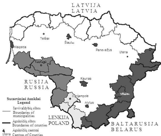
1 pav. BVP 1 gyv. kaitos skirtumai pasienio savivaldybėse 1996–2001 m. (nuokrypis nuo Lietuvos vidurkio %)

Fig 1. Differences of GDP per capita growth in municipalities in 1996–2001 (% from Lithuanian average)